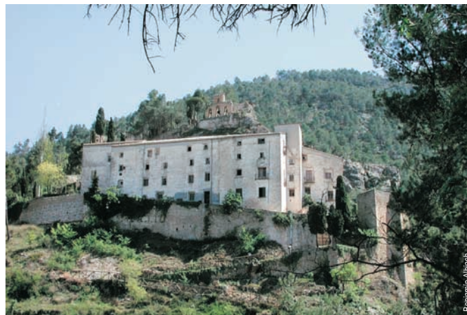
Santuario de la Virgen de Agres