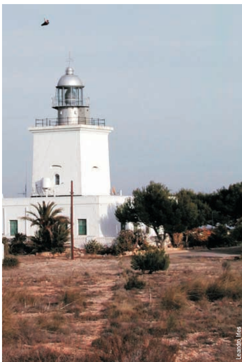
El faro de Santa Pola

entidad promotora: Ayuntamiento de Santa Pola